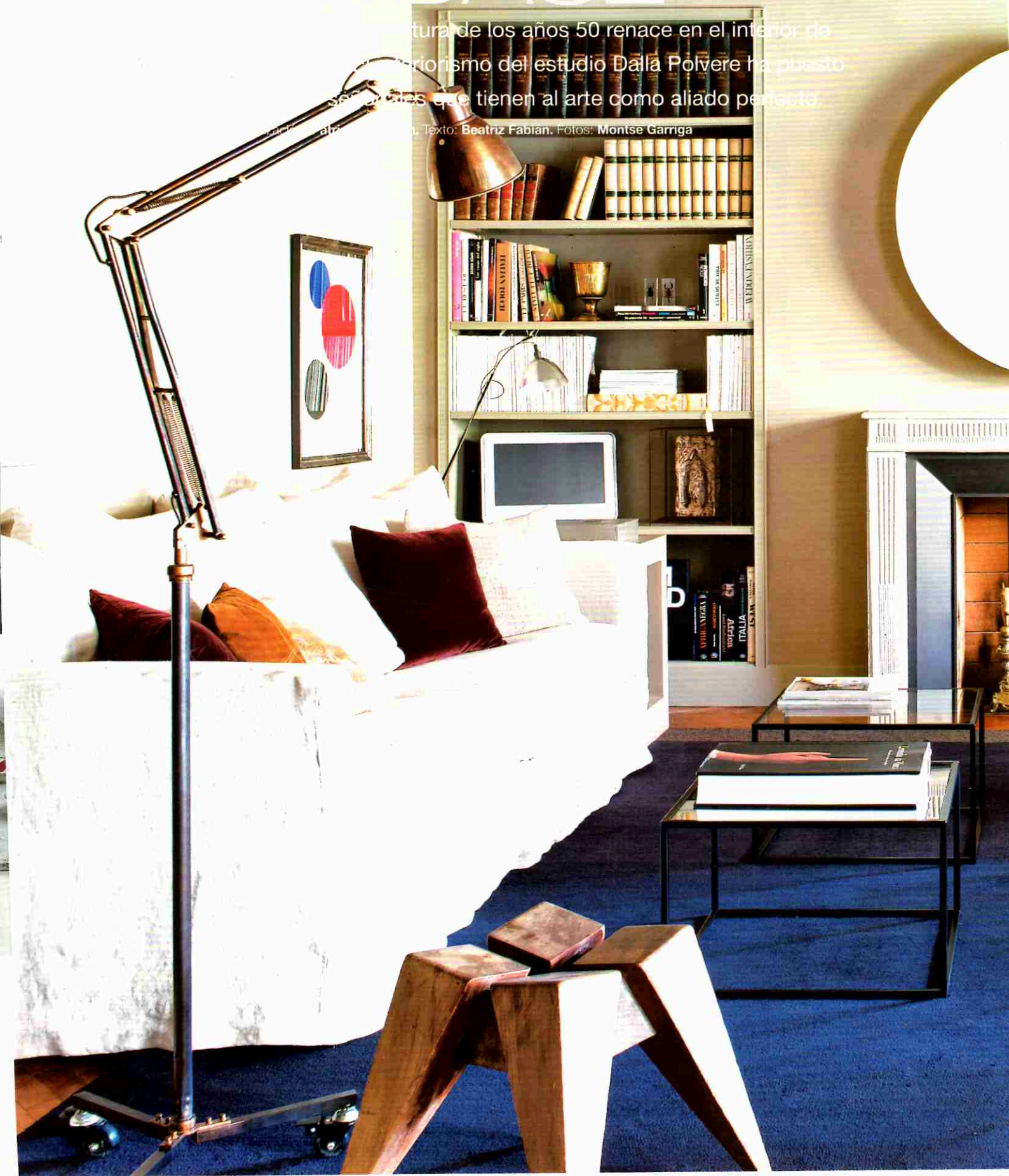
Texto: Beatriz Fabian.

La arquitectura de los años 50 renace en el interior de este estudio. El minimalismo del estudio Dalla Polvere ha puesto a disposición de los usuarios un espacio que tienen al arte como aliado perfecto.